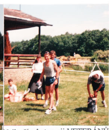
Nejlepší v kategorii VETERÁNŮ