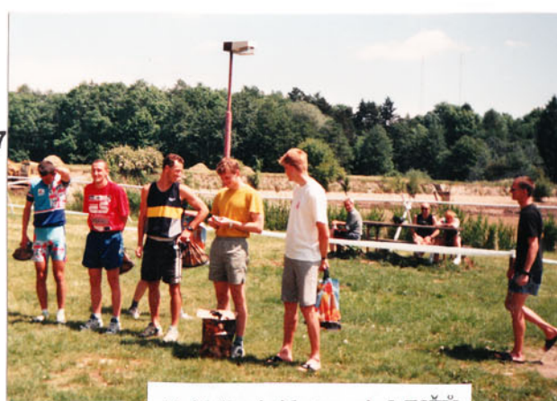
Vyhlašování kategorie MUŽŮ